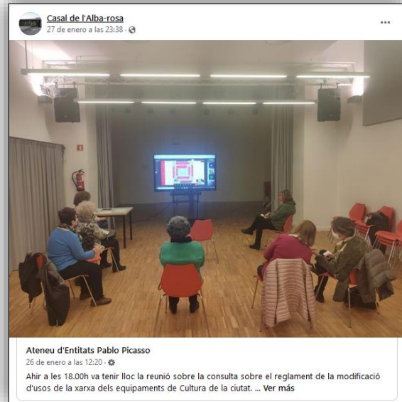
Ateneu d'Entitats Pablo Picasso 26 de enero a las 12:20 · 🌐 Ahir a les 18.00h va tenir lloc la reunió sobre la consulta sobre el reglament de la modificació d'usos de la xarxa dels equipaments de Cultura de la ciutat. ... Ver más