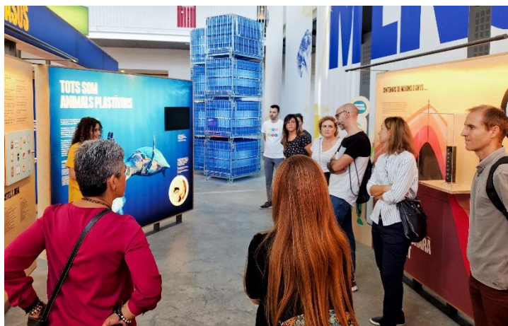
Moment de la visita a l'exposició "Menja, Actua, Impacta"

Després d'una breu presentació dels assistents, es va realitzar la visita a l'exposició "Menja, Actua, Impacta", que va generar un gran interès entre els membres de la Taula d'Emergència Climàtica. El grup es va detenir més estona als panells sobre malbaratament alimentari.