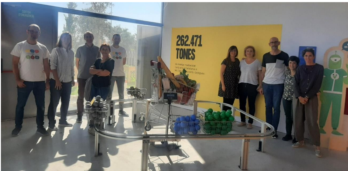
Foto final dels assistents a la sessió de la Taula d'Emergència Climàtica

Per acabar, es van presentar els propers passos de la Taula (calendari) i es va agrair la participació. També es va realitzar una foto de grup al final de la sessió.