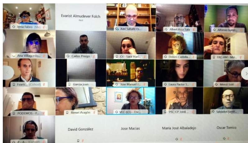
Captura de pantalla de la constitució de la Taula per l'Emergència Climàtica de Viladecans.