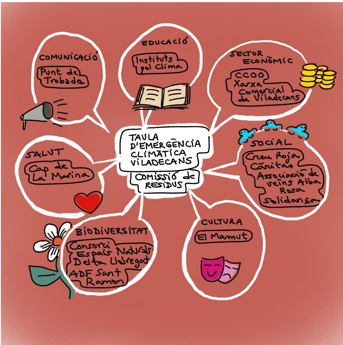
Figura 2. La diversitat de perfils i mirades a la Taula d'Emergència Climàtica de Viladecans

Ana Villagordo destaca la diversitat de perfils i mirades present a la Taula d'Emergència Climàtica de Viladecans, i l'interès d'enriquir-la amb les aportacions realitzades durant la sessió.